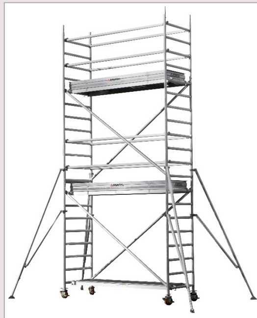
Echafaudage SATURNE. Hauteur de plancher 5.5 mètres