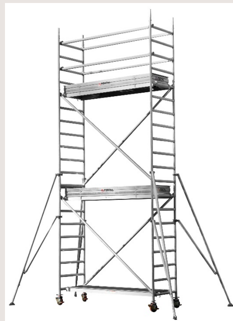
Echafaudage SATURNE – hauteur de plancher 5.5 mètres