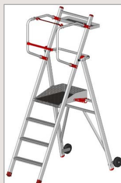
Modèle 4 marches