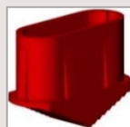
Patin chaussette 65 x 25 avant A750011015 6.70 € HT