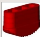
Patin 65 x 25 arrière A750016527 6.00 € HT