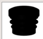
Bouchon sous lisse arrière A750030025 1.20 € HT