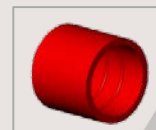
Bouchon rouge pour garde-corps A750011015 3.00 € HT