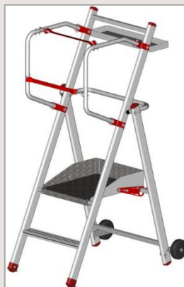
Modèle 2 marches