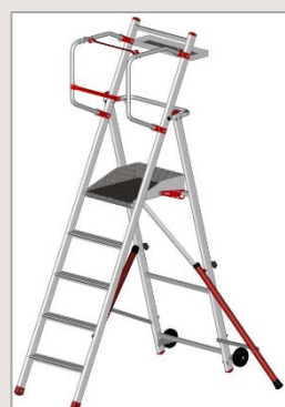
Modèle 5 marches