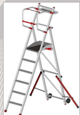
Modèle 6 marches