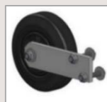
Kit roue Ø 125 F030091805