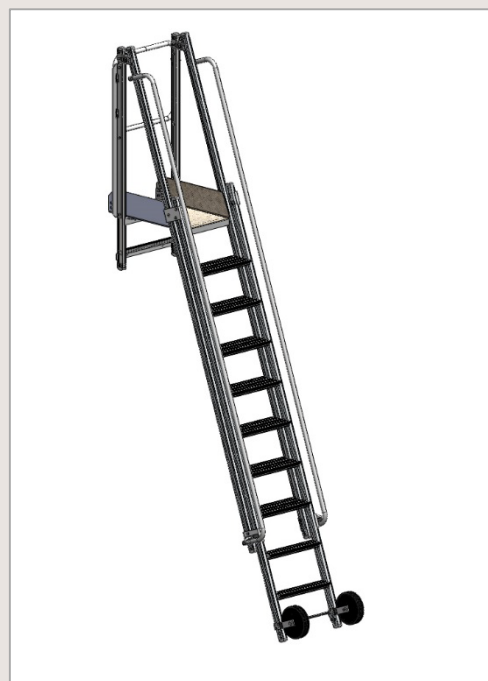
Plateforme grande hauteur accès prémur PAP + portillon

Référence : F0901600012-EIF Désignation : Plateforme accès prémur + portillon grande hauteur