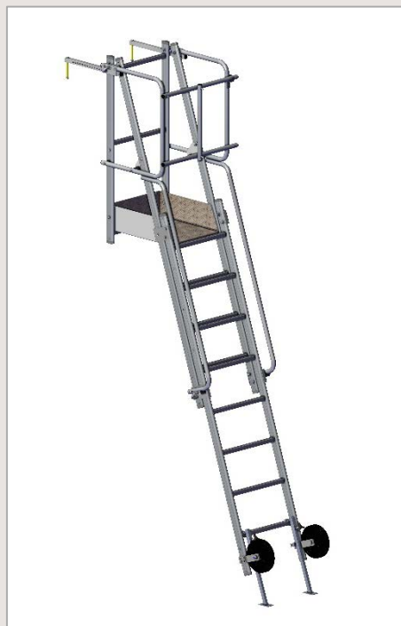
Plateforme accès dalle PAP + portillon

Référence : F0901600012 PAP à barreau + portillon 1990/2700