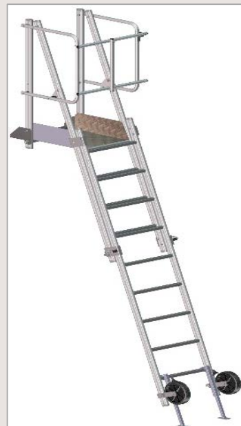
Plateforme accès dalle PAD + portillon

Référence : F090165012 Désignation : PAD à barreau + portillon