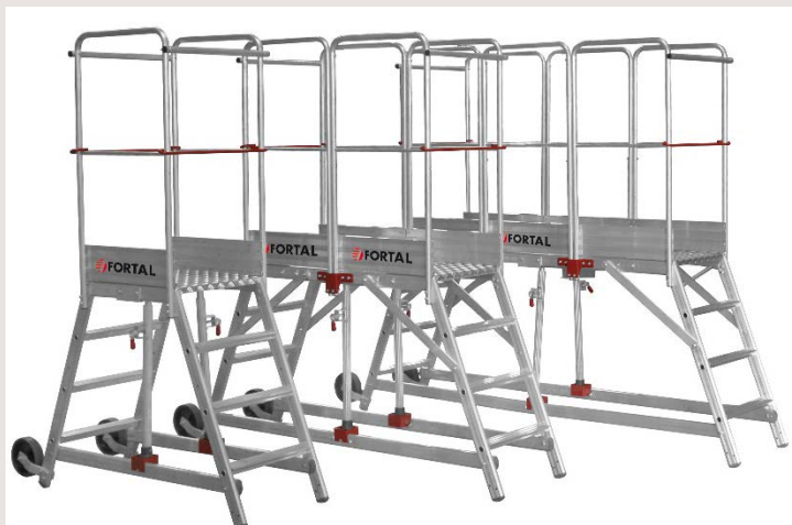
Plateforme entre banche modèles 550 - 1105 - 1656